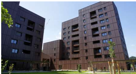
Les Bois d'Angers bénéficient d'une architecture innovante sur le plan écologique.

C'est à l'intersection de l'avenue de Notre-Dame-du-Lac et du boulevard Victor-Beaussier que les Bois d'Angers ont pris racine. L'immeuble en bois comprend 75 logements en accession à la propriété, dont 25 % à un prix abordable, tous étant par ailleurs adaptables au vieillissement et à la perte d'autonomie.