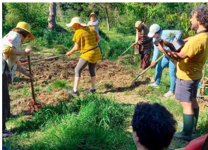
Le jardin favorise la convivialité, l'échange et le partage.

Plus d'informations : 07 44 41 42 16 - lesbellespailles@gmail.com (permanence sur site le samedi, de 10 h à 13 h).