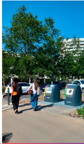
Un point d'apport volontaire récemment installé à l'angle des rues Gaubert et Melgrani.