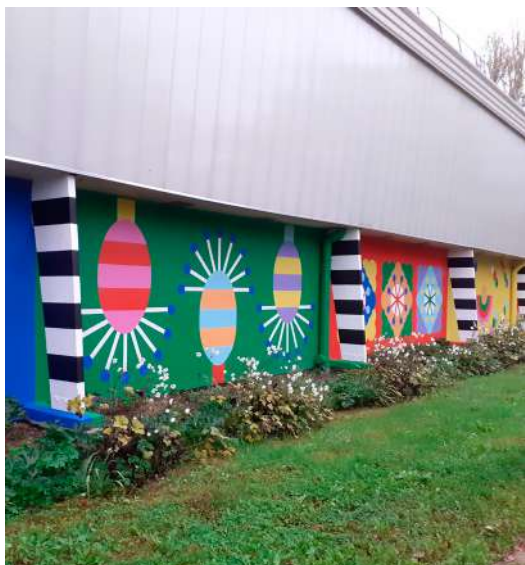
La fresque « De la couleur dans la ville », le long du gymnase, chemin du Petit-Bonheur, sera complétée en fin d'année.