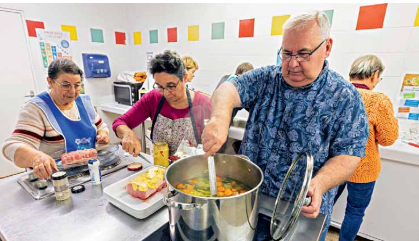
Les bénévoles de l'association trélazéenne Consommation logement cadre de vie, ci-dessus, préparent le repas partagé au centre social Ginette-Leroux. Le but est de créer du lien et de promouvoir le bien manger auprès d'un public qui peut être isolé ou aux revenus modestes. L'association Eoliharpe, ci-dessous, organise un atelier musique tout public. L'idée : se concentrer sur le chant, laisser ses problèmes de côté et retrouver sa place au sein d'un groupe.