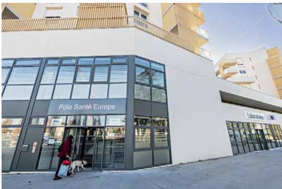
Le nouveau pôle santé est installé au nord de la place de l'Europe, au rez-de-chaussée du bâtiment construit par Angers Loire Habitat.