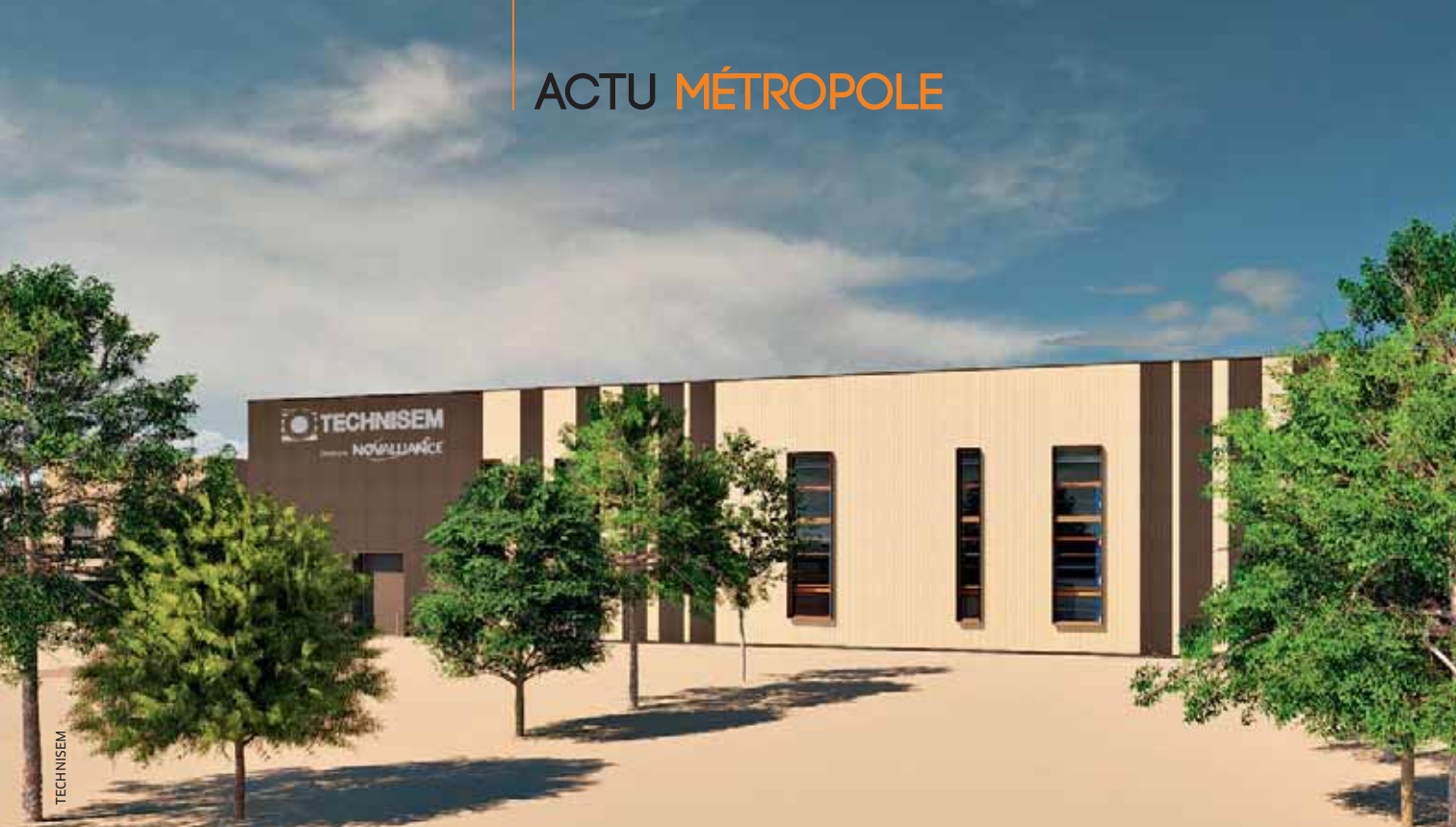
Image de synthèse du futur site de Technisem à Corné.