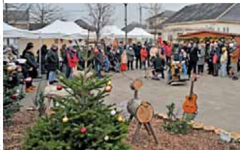
COMMUNE DE MONTEUIL-JUIGNÉ

Avrillé lance son "Noël magique" les 12 et 13 décembre, de 16 h à 20 h 30, sur l'esplanade de l'hôtel de ville : stands, ateliers créatifs, animations féeriques et spectacles. "Noël est dans les places", à Montreuil-Juigné, propose une parade aux lampions le vendredi 12 décembre, et le traditionnel spectacle pyrotechnique le lendemain, à 19h, place de la République, suivi du marché de Noël le dimanche (photo). Feneu prépare un atelier biscuits le samedi 20 décembre, une marche aux lampions et une lecture de contes de Noël le dimanche 21 décembre et un après-midi jeux le mardi 23. Renseignements : avrille.fr , montreuil-juigne.fr et feneu.fr