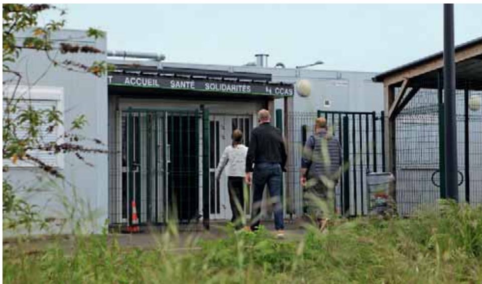
Le Pass occupe depuis 2018 des bâtiments modulaires au bout de l'avenue Montaigne.

C'est une adresse essentielle depuis 1995. Celle des personnes sans abri ou en situation de grande précarité, demandeurs d'asile, jeunes, femmes, familles avec enfants ou encore en souffrance psychique. Plus de 130 personnes y trouvent refuge chaque jour. Le Point Accueil Santé Solidarités (Pass) de la Ville propose un accompagnement global, anonyme et inconditionnel et un ensemble de services. Parmi eux : la possibilité de prendre une douche, de laver et sécher son linge, de profiter d'une boisson chaude, d'une salle de repos, d'un chenil, d'une bagagerie sociale pour y déposer ses affaires en sécurité, d'une aide dans la réalisation de démarches administratives. Mais aussi des permanences d'écoute