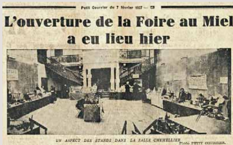
Vue d'ensemble de la foire au miel, salle Chemellier, dans "Le Petit Courrier", 7 février 1937.

La foire au miel est née en 1921, d'abord liée à la foire Saint-Martin. L'initiative en revient à l'Union des apiculteurs de l'Anjou. L'apiculture est alors encore considérée comme une industrie un peu nouvelle. La foire doit permettre aux acheteurs en gros ainsi qu'à tous les amateurs de miel de se procurer les produits de la ruche directement auprès des producteurs. L'Anjou paraît une région tout indiquée pour ce genre de foire. Peu de départements sont aussi privilégiés au regard des fleurs, innombrables aliments pour les abeilles.