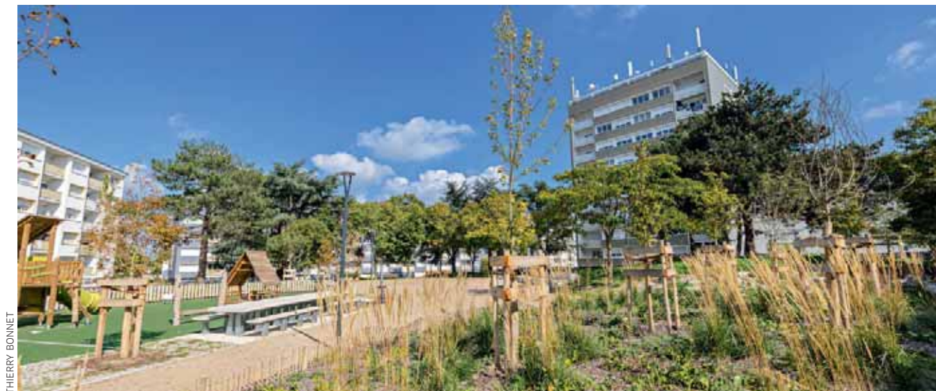
Les réaménagements de l'îlot Baron ont permis de développer les surfaces végétales.

La rénovation urbaine de Monplaisir livre un nouvel espace requalifié: l'îlot Baron. Le site, entouré par la rue du même nom, a en effet connu un sacré coup de jeune. Pour rappel, côté habitat, Podeliha avait déjà réhabilité 256 logements et créé 26 appartements adaptés aux seniors au sein de la résidence.