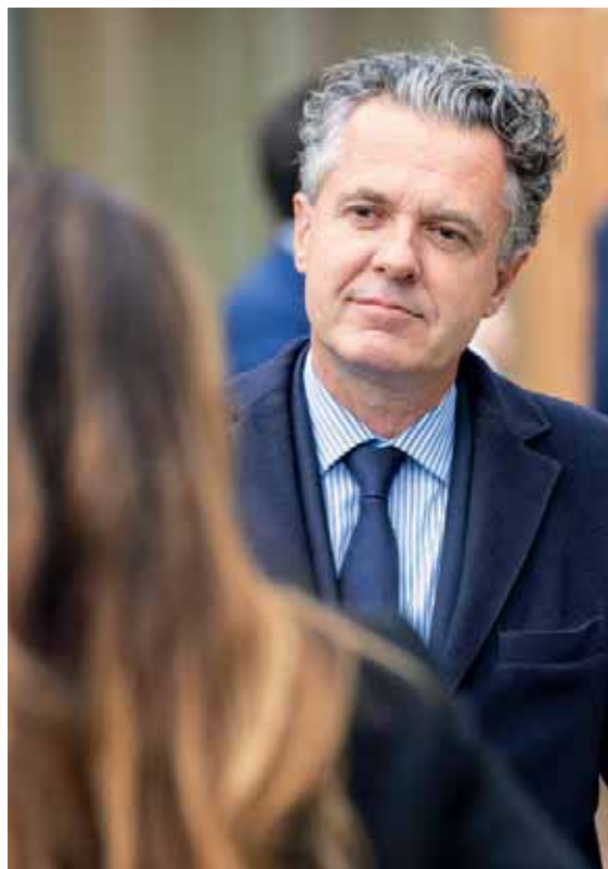
Christophe Béchu maire d'Angers

Je vous souhaite à tous un mois de décembre rempli de moments passés avec vos proches. Que la joie de Noël vienne conclure une année de mobilisation et d'attention pour chacun. ■