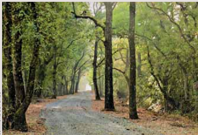
COMMUNE DE FENEU