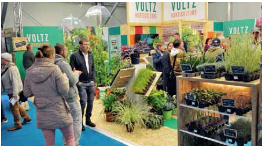
Le Sival rassemble 700 exposants des filières du végétal spécialisé.

La 39 e édition du Sival, salon professionnel des filières du végétal spécialisé, se tiendra comme de coutume au parc des expositions d'Angers, du 13 au 15 janvier. Plus de 700 exposants et 26 000 visiteurs français et internationaux se retrouvent chaque année pour découvrir les nouveautés du secteur agricole : machinisme, technologie, services, agrofournitures dans les domaines des fruits, légumes, vins, cidres, semences ou fleurs... Mais aussi pour rencontrer des fournisseurs,