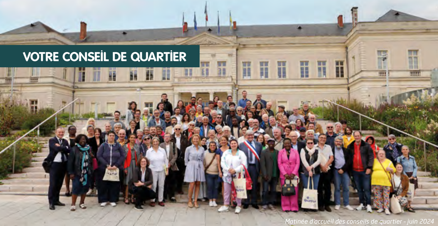
Matinée d'accueil des conseils de quartier - juin 2024

Depuis 2021, les membres du conseil de quartier ont participé à l'amélioration du quotidien des habitants du quartier Belle-Beille. Lors des réunions plénières ou dans des groupes de travail, ils ont élaboré collectivement des propositions, toujours soucieux de trouver des réponses adaptées aux enjeux de leur quartier. Leurs contributions, dans le cadre de saisines des élus de la Ville d'Angers ou sur des sujets de préoccupation des habitants dont ils ont choisi de s'emparer, sont essentielles pour le développement du quartier.