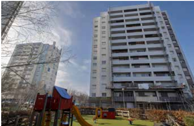
Les quatre tours Gaubert font l'objet d'une réhabilitation d'ampleur touchant l'intérieur et l'extérieur des résidences. Objectif : plus de confort et moins de charges pour les locataires.

Engagée début 2021, la réhabilitation complète de la tour du n°7, rue Pierre-Gaubert est achevée.