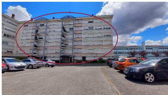
Vue depuis l'îlot Baron