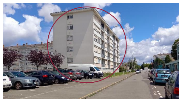
Vue depuis la rue Suard