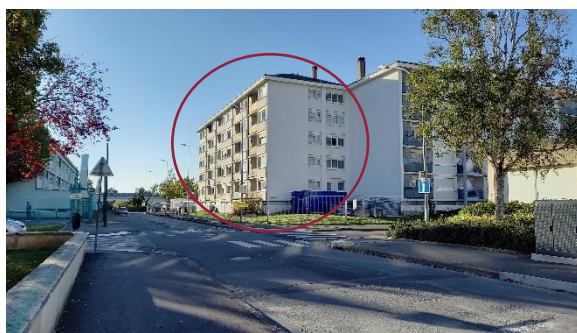
Vue depuis le Bd Schuman