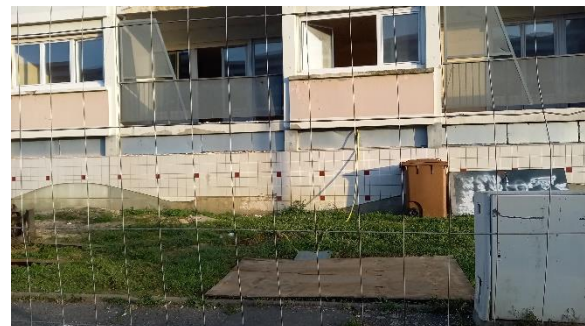
Déconstruction en cours