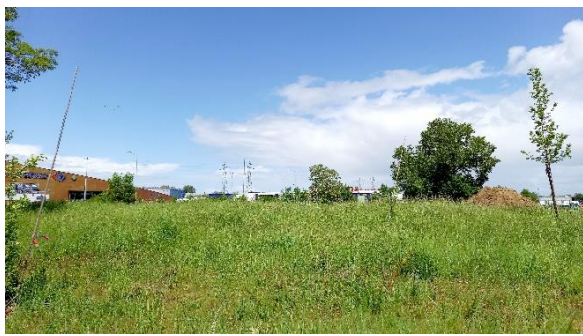
Centre de la parcelle