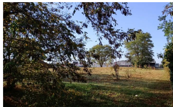
Vues depuis le parking