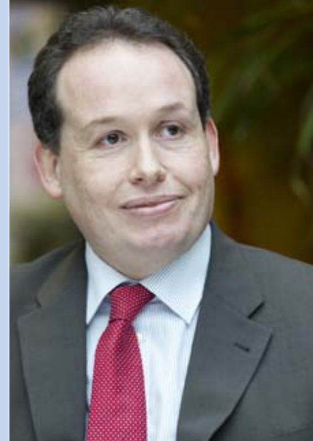
Frédéric Béatse Maire d'Angers