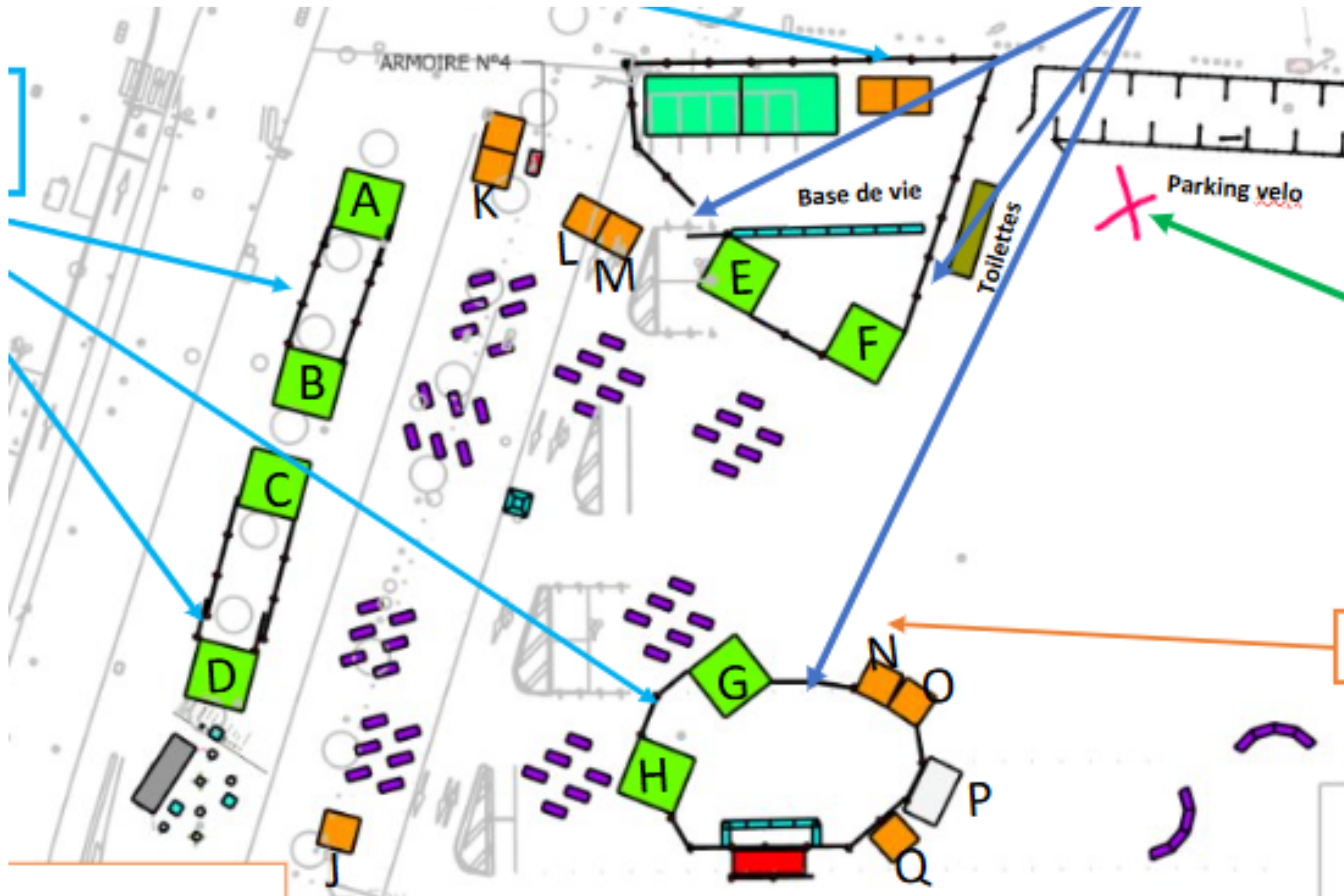
Plan du village des saveurs 2025. 8 stands (A, B, C, D, E, F, G, H), 8 associations