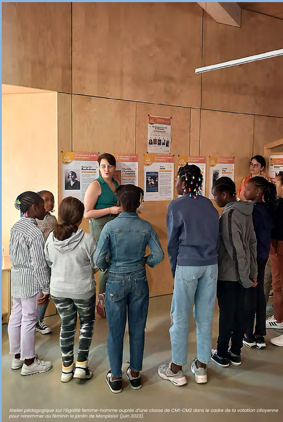
Atelier pédagogique sur l'égalité femme-homme auprès d'une classe de CM1-CM2 dans le cadre de la votation citoyenne pour renommer au féminin le jardin de Monplaisir (juin 2023).