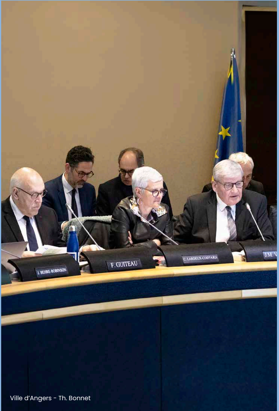
Ville d'Angers - Th. Bonnet