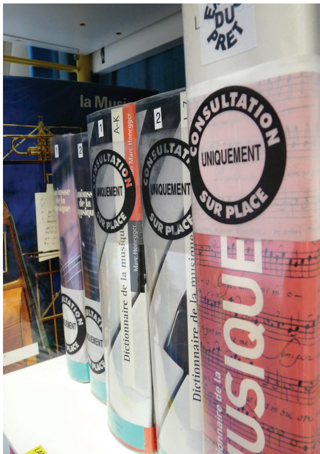
Réalisation : Service communication et action culturelle CRR d'Angers - H.Adam - Mai 2015 - Impression : Ville d'Angers / Angers Loire Métropole