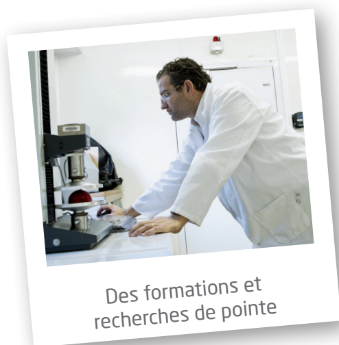
Des formations et recherches de pointe