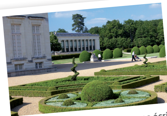
* Le Domaine de Pignerolle comme écrin Situé au cœur de 80 hectares en partie boisés et d'un jardin à la française, il abrite aujourd'hui le musée de la communication.

Chaque groupe a pour mission d'aménager une parcelle de 40m 2 maximum dans le potager du domaine de Pignerolle. Le public pourra profiter de ce spectacle de couleurs et d'idées tout au long de l'été et voter pour son jardin préféré. Deux prix seront délivrés : l'un par le public, l'autre par un jury de professionnels. Le gagnant de l'édition aura son jardin exposé au plus près du public l'année suivante.