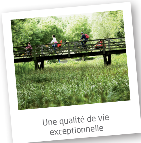
Une qualité de vie exceptionnelle