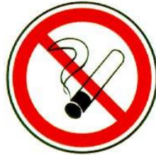
INTERDICTION DE FUMER