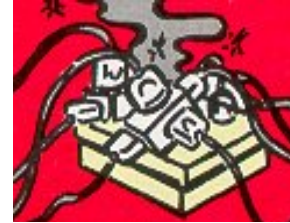
Attention aux surcharges électriques