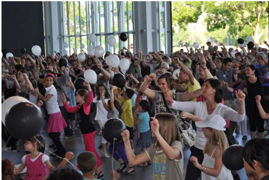
Bal moderne au Théâtre le Quai le 3-06-10

"Favoriser le plaisir des angevins à se retrouver ensemble, et donner sens à leur quotidien grâce à la culture"