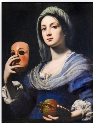
L'allégorie de la simulation

Bref, des choses qui incitent à dépasser le stade «du j'aime ou j'aime pas ».